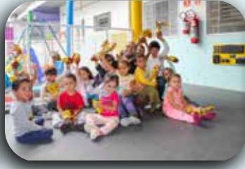
CEI Sagrado Coração.