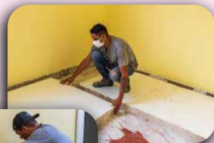
Reparo no piso na Casa dos Religiosos.