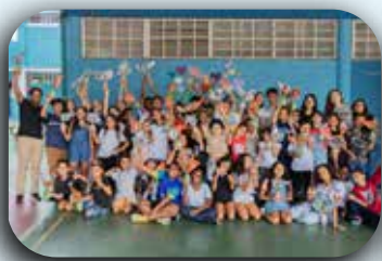
CCA Pe. Gregório.

Neste ano de 2025, mais uma vez vivemos a alegria de tornar a Páscoa mais doce e especial para nossas crianças. Graças à generosidade de muitos corações solidários, conseguimos entregar ovos de Páscoa, chocolates e caixas de bombons. Foi emocionante ver nossa sede se encher de doçuras e carinho — alguns nos trouxeram chocolates pessoalmente, outros contribuíram com doações em dinheiro, permitindo a compra dos ovos, e houve ainda quem mobilizou empresas e amigos para abraçar essa causa conosco. A Direção do IMSJT agradece de coração a todos os benfeitores que, com amor e união, tomaram possível esse gesto de afeto e esperança. Que Deus retribua em bênçãos cada ato de generosidade. Compartilhamos abaixo alguns registros desse momento tão especial com nossos atendidos. Amar é a nossa missão!