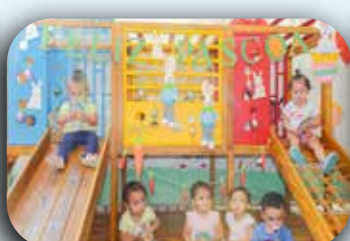
CEI Sagrada Família.