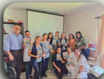
CEI Mãe Operária.