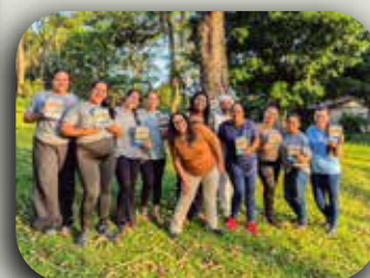
CEI Padre Dehon.