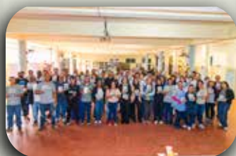
Sede do Instituto.