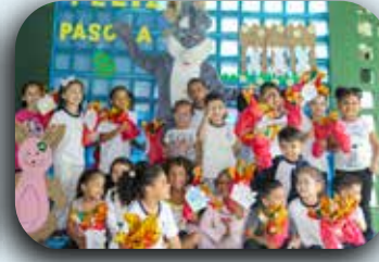
CEI Santa Catarina.