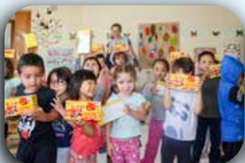
CEI João Paulo II.