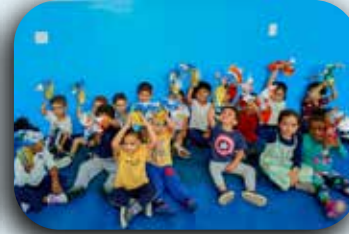
CEI Padre Gregório.