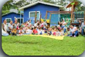
CEI Padre Dehon.