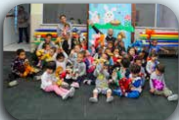
CEI São Francisco.