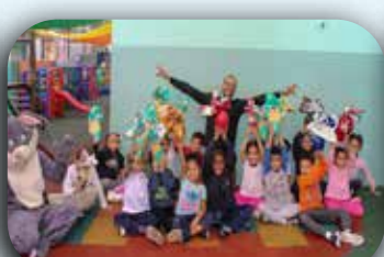
CEI Mãe Operária.