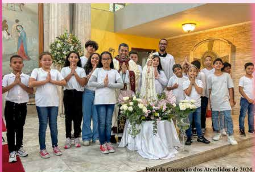
Foto da Coroação dos Atendidos de 2024.