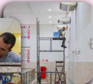
Pintura no interior da Capela São José.