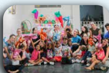
CEI São José.