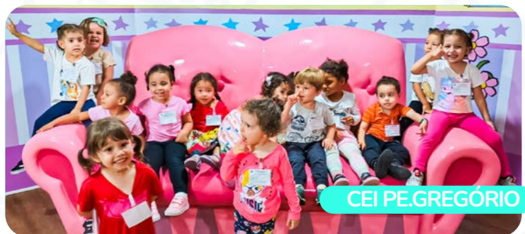
CEI PE. GREGÓRIO