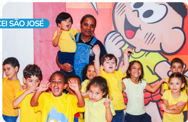
CEI SÃO JOSÉ