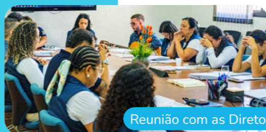
Reunião com as Diretoras