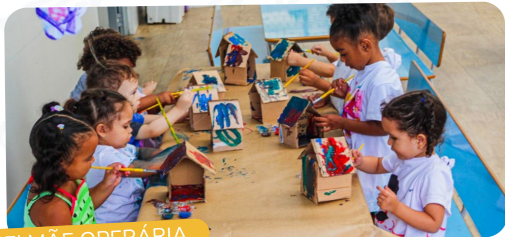
CEI MÃE OPERÁRIA

O mês de abril foi bastante movimentado em nossas unidades, repleto de atividades pensadas com carinho para os pequenos, que aproveitam cada momento com alegria e curiosidade. Todo o trabalho desenvolvido pelas professoras tem como objetivo estimular o desenvolvimento integral das crianças , com propostas que envolvem coordenação motora , exploração de diferentes texturas e experiências adequadas a cada faixa etária, desde os bebês até os maiores. Cada conquista é valorizada, celebrada e compartilhada com as famílias, fortalecendo esse vínculo tão importante .