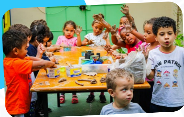
CEI SÃO JOSÉ