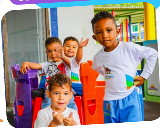
CEI PADRE DEHON

O mês de abril foi bastante movimentado em nossas unidades, repleto de atividades pensadas com carinho para os pequenos, que aproveitam cada momento com alegria e curiosidade. Todo o trabalho desenvolvido pelas professoras tem como objetivo estimular o desenvolvimento integral das crianças , com propostas que envolvem coordenação motora , exploração de diferentes texturas e experiências adequadas a cada faixa etária, desde os bebês até os maiores. Cada conquista é valorizada, celebrada e compartilhada com as famílias, fortalecendo esse vínculo tão importante .