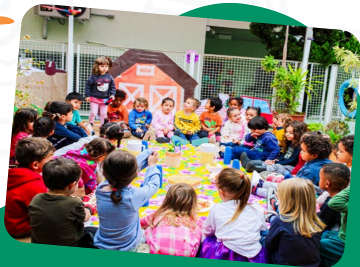
CEI JOÃO PAULO II