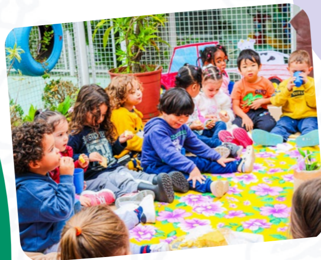
CEI MÃE OPERÁRIA