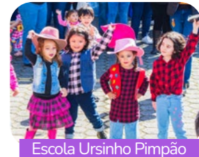
Escola Ursinho Pimpão