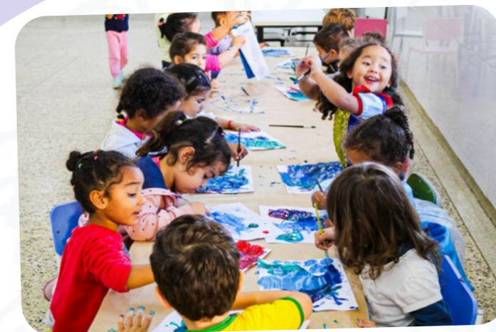
CEI SAGRADO CORAÇÃO