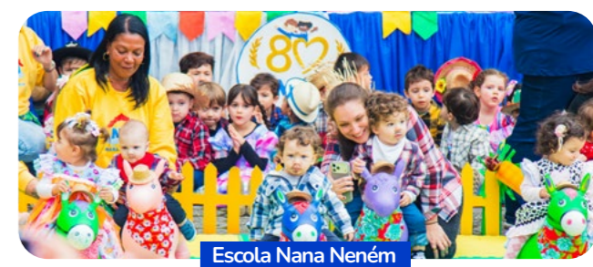
Escola Nana Neném