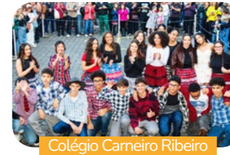
Colégio Carneiro Ribeiro